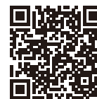
事業維持員は こちらで確認 できます