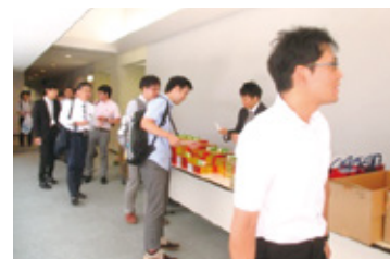
▶講演会参加票に整理券引換チェック欄がございます。