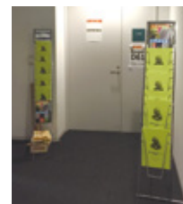
カタログスタンド